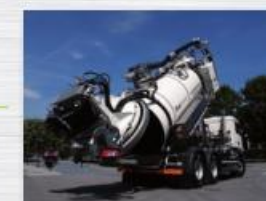
Sistem za pražnjenje