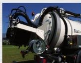
Prsten za zaključavanje