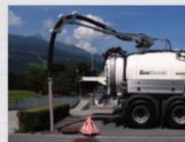
Usisna ruka KSR10