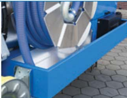
Otvoreni deo za skladištenje