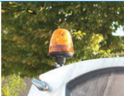
Rotacija / radno osvetljenje