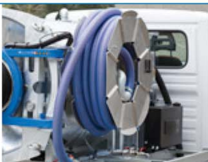
Ručno/hidraulični kotur uključujući kotrljajući ležaj za dovod