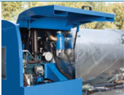
Poklopac preko motora/odeljka pumpe

Pored ovih Opcija, UniCom se može proširiti i sa brojnim drugim opcijama, kao što je da bojenje rezervoara u prilagođenu boju, 900/600 ili 800/700 litarski rezervoar t(nasuprot standardnom 1000/500), sistem pulsatora, usisni sistem, dizel motori umesto benzinskih motora i Y stege.