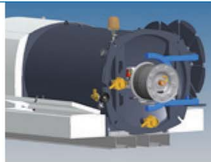
Zatvoreni deo za skladištenje