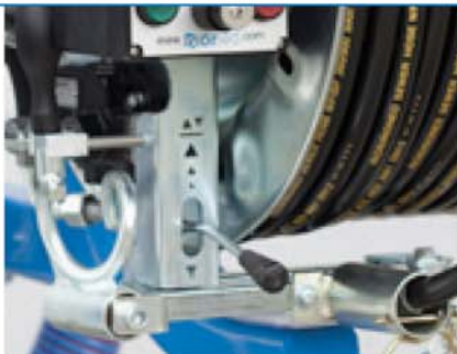
Hidraulični kotur za rad pod visokim pritiskom