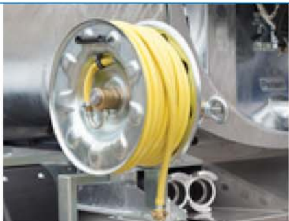
Ručno namotavanje kotura