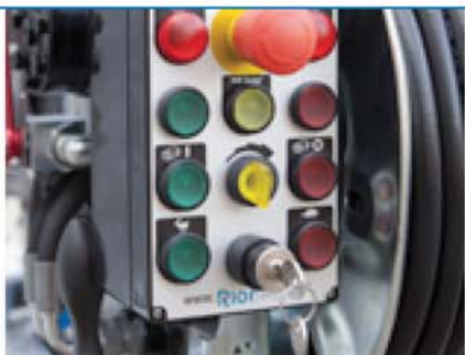
Zaštita od rada na suvo, sa bypass dugmetom