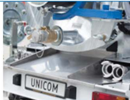
Odvod od nerđajućeg čelika